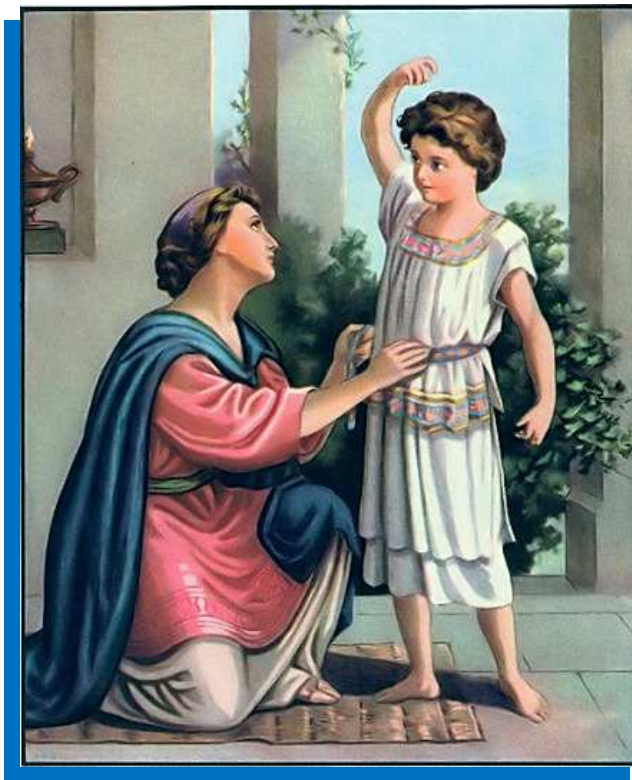
Anna e Samuele

Anna, la mamma di Samuele, è sterile. Quando nasce Samuele, eleva a Dio un bellissimo Cantico, che inizia così: Il mio cuore esulta nel Signore, la mia fronte si innalza, grazie al mio Dio... io godo del beneficio che mi ha concesso. 1 Samuele 2, 1.