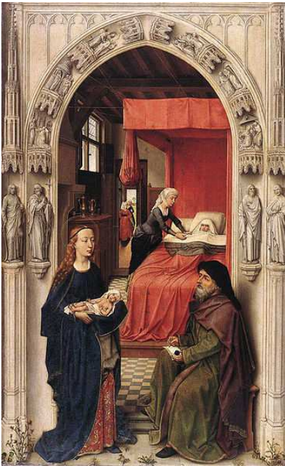
Zaccaria scrive il nome del Battista- Rogier van de Weyden

Elisabetta è sposa del sacerdote Zaccaria, che non crede alle rivelazioni, ma il piano del Signore sussiste per sempre . Salmo 33 (32), 11 . Nascerà, infatti, Giovanni.